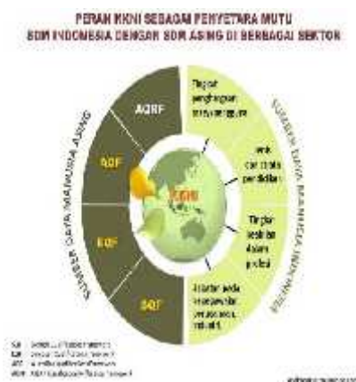
Gambar 2. Peran KKNi

Selanjutnya, KKNi merujuk sistem kualifikasi negara lain, seperti Scotlandia, Eropa, Amerika, dan kelompok negara ASEAN. European Qualification Framework (EQF) terbagi atas delapan tingkat penjenjangan kualifikasi. Dimulai dari kemampuan pengetahuan dasar sampai pada kemampuan tertinggi seperti lulusan doctor. EQF menganut konsep pembelajaran sepanjang hayat. Berbeda dengan itu, Australian Qualification Framework (AQF) merujuk pada sistem kualifikasi yang memilah sector pendidikan dan pelatihan dalam tiga bagian, yakni sekolah menengah, pelatihan dan pendidikan vokasi, dan pendidikan tinggi. Namun, perlu dipahami sistem kualifikasi AQF dianggap terlalu rinci sehingga belum tepat digunakan di Indonesia. Itu sebabnya, EQF yang dianggap yang paling tepat, maka tidak heran EQF memberikan pengaruh yang kuat dalam pengembangan dan penyusunan KKNi. Adapun penggunaan sistem kualifikasi oleh pemerintah agar produk lulusan KKNi dapat diterima oleh negara lain sehingga tenaga kerja Indonesia terserap dengan cepat.